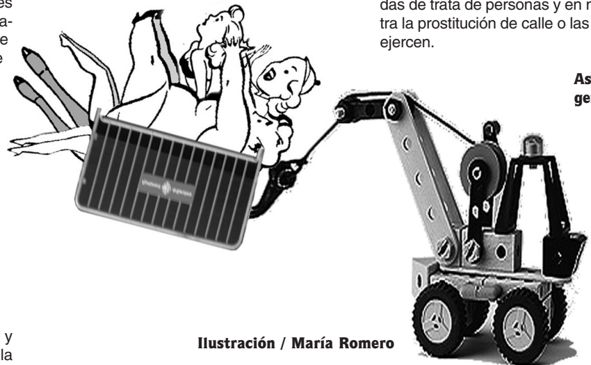
Ilustración / María Romero

- La presencia de mediadoras, intérpretes u observadoras independientes que puedan garantizar un trato correcto sin violencia ni